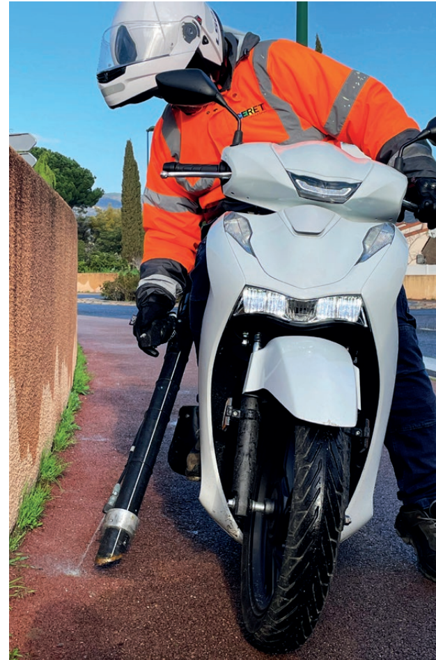
La moto-crotte nettoie la ville toute la semaine

Au-delà de la sanction, la Ville souhaite avant tout rappeler que la propreté de Céret dépend de tous. Préserver nos trottoirs, nos places et nos jardins, c'est préserver le plaisir de vivre ensemble dans une ville accueillante, propre et respectueuse de chacun.