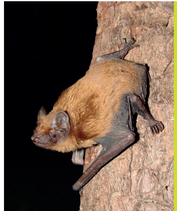
Les platanes abritent une espèce rare

Cette découverte distingue encore davantage les platanes de Céret, déjà officiellement catégorisés arbres remarquables. "À partir du moment où on a cette espèce dans les platanes, on ne peut pas faire n'importe quoi", prévient Boris Baillat. Les chauves-souris supportent bien la proximité humaine, mais restent très sensibles aux interventions sur les arbres qui les abritent. La commune, informée de la découverte, veillera à adapter ses pratiques d'entretien pour préserver ces hôtes discrets. Dans les mois à venir, le naturaliste aimerait poursuivre l'observation, notamment en posant des GPS miniatures sur certaines chauves-souris afin de mieux comprendre leurs déplacements à travers l'Europe.