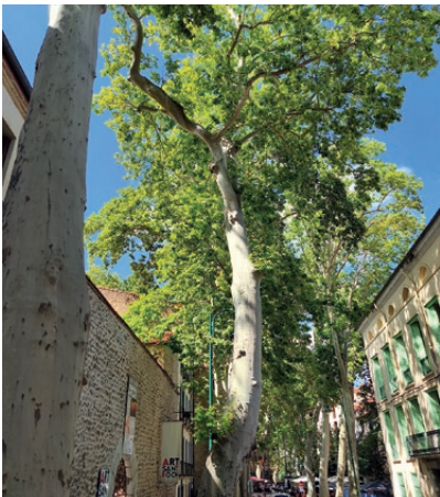
Les chauves-souris vivent au-dessus du France et de la salle de l'Union

S ous les platanes de Céret, la vie nocturne réserve des surprises. Depuis plusieurs mois, le naturaliste céretan Boris Baillat, spécialiste des chauves-souris, mène un travail d'observation et d'écoute inédit. "Ces platanes sont super !", raconte-t-il. "J'ai commencé à poser des boîtiers acoustiques et très vite, les résultats ont montré une activité exceptionnelle". Ces boîtiers n'enregistrent pas d'images, mais les ultrasons émis par les chauves-souris pour se repérer. "Chaque espèce a une signature acoustique qui lui est propre", explique le naturaliste chiroptérologue. Les données récoltées sont ensuite analysées sur ordinateur pour identifier précisément les espèces présentes.