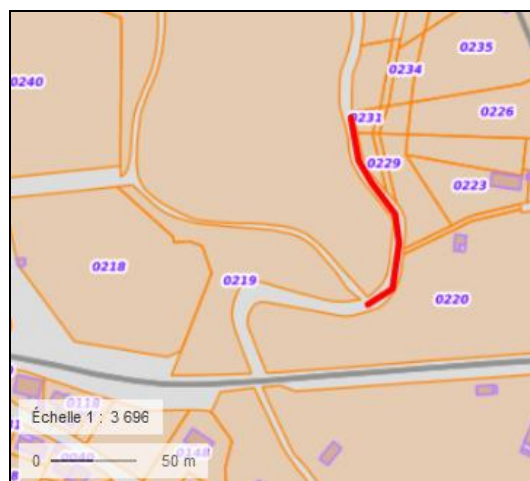
Carte : Localisation du linéaire à aménager sur fond IGN et sur le cadastre